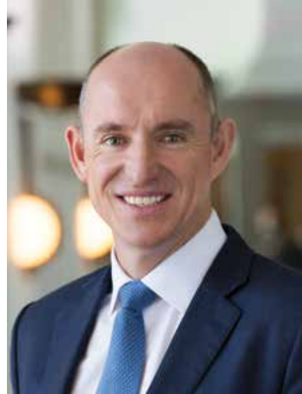
Stuart Robert Minister for Human Services

如果您想返回工作，這裡有關於Work Bonus的訊息，可以幫助您從工作中賺錢的同時還能保持更多養老金。我鼓勵那些希望有多一點財務自由的領取養老金人士考慮返回工作並利用Work Bonus措施。您可以在「工作獎金」文章內找到更多訊息。